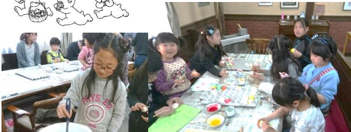
今年のイースターエッグ みんな頑張ったね。