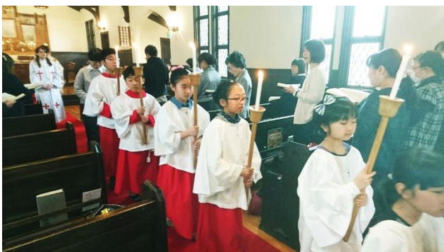
アコライトの子ども達