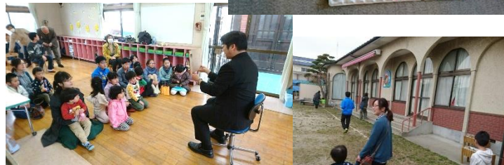
エッグハンティング⇒